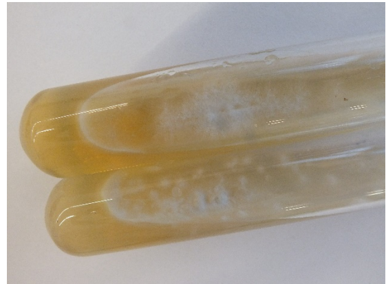
Abb. 1 Fläche, weiße Kolonien von Trichophyton (T.) erinacei . Primärkultur auf Sabouraud-Glukose-Schrägagar im Reagenzglas-Röhrchen.

Der „Igelpilz“ Trichophyton (T.) erinacei verursacht als ein sogenanntes Emerging Pathogen in ganz Deutschland Dermatophytosen beim Menschen. Der zoophile Dermatophyt wird vom Igel auf den Menschen übertragen und führt zu meist stark entzündlichen Formen der Tinea manus oder Tinea corporis. Infektionsquelle ist der geschützte mitteleuropäische Igel. Aber immer