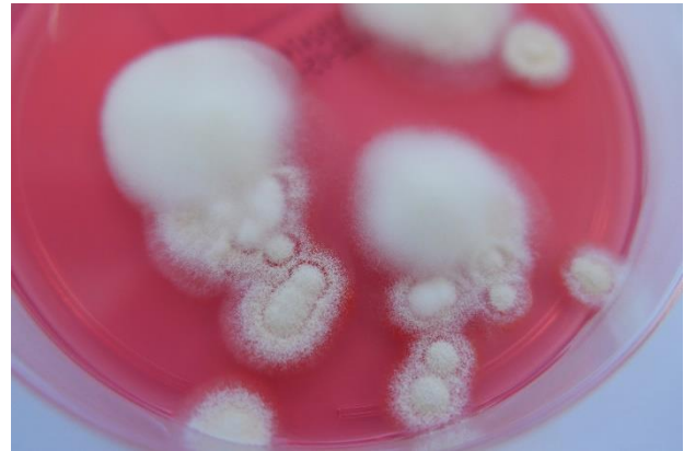
Abb. 1 Auf Taplin-Agar entwickelt sich aus den Hautschuppen weiße Kolonien von Arthroderma (A.) crocatum mit flaumiger und granulärer Oberfläche. Dermatophyten-Selektiv-Agar/“Taplin-Agar“ (bioMérieux, Nürtingen)

Arthroderma (A.) crocatum ist ein geophiler Dermatophyt, der 1988 erstmals in Japan beschrieben wurde. Er wurde in der unbelebten Umwelt (Erdboden) nachgewiesen, aber in Einzelfällen auch aus menschlichen Hautschuppen und Nagelmaterial isoliert. Auch in Deutschland gibt es einzelne Fälle in denen A. crocatum identifiziert wurde. A. crocatum ist ein eher apathogener Dermatophyt, so dass beim