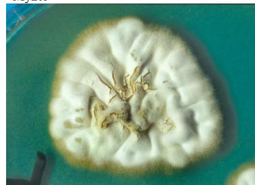
Abb. 3 Pleomorphismus, bei Subkultivierung wird der Thallus weiß durch Bildung von „sterilem“ Myzel, was bedeuten soll, dass kaum noch Makrokonidien vorhanden sind