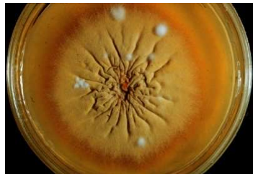
Abb. 2 E. floccosum auf Sabouraud-4%-Glukose-Agar mit flachem, olivgrünem Myzel

Sowohl auf Sabouraud-Glukose-Agar (alternativ Kimmig-Agar), als auch auf Mycosel-Agar, wächst der Dermatophyt mittelschnell, zunächst weiß. Aber schon nach wenigen Tagen nimmt der Thallus seine charakteristische grünlich-gelbe („olivgrüne“) Färbung an. Die Variationsbreite ist jedoch erstaunlich groß, so dass auch violette oder rosa gefärbte Isolate möglich sind. Die Kolonien sind gewöhnlich flach mit zentraler, knopfartiger Erhebung und durchzogen von radiären Furchen und Falten. Nach 10 d bei 30°C hat die Kolonie einen Durchmesser von 10-25 mm. Typisch ist der bereits nach drei Wochen einsetzende sog. Pleomorphismus, erkennbar an den weißen, watteähnlichen Luftmyzeflöckchen inmitten der Kolonien. Mit zunehmendem Alter und bereits nach wenigen Subkulturen wird der Pilz vollständig pleomorph und