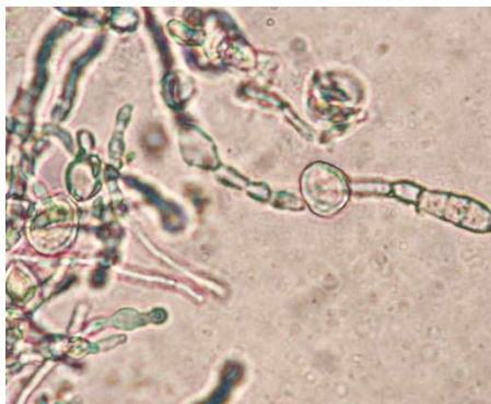
Abb. 5 Chlamydosporen von E. floccosum