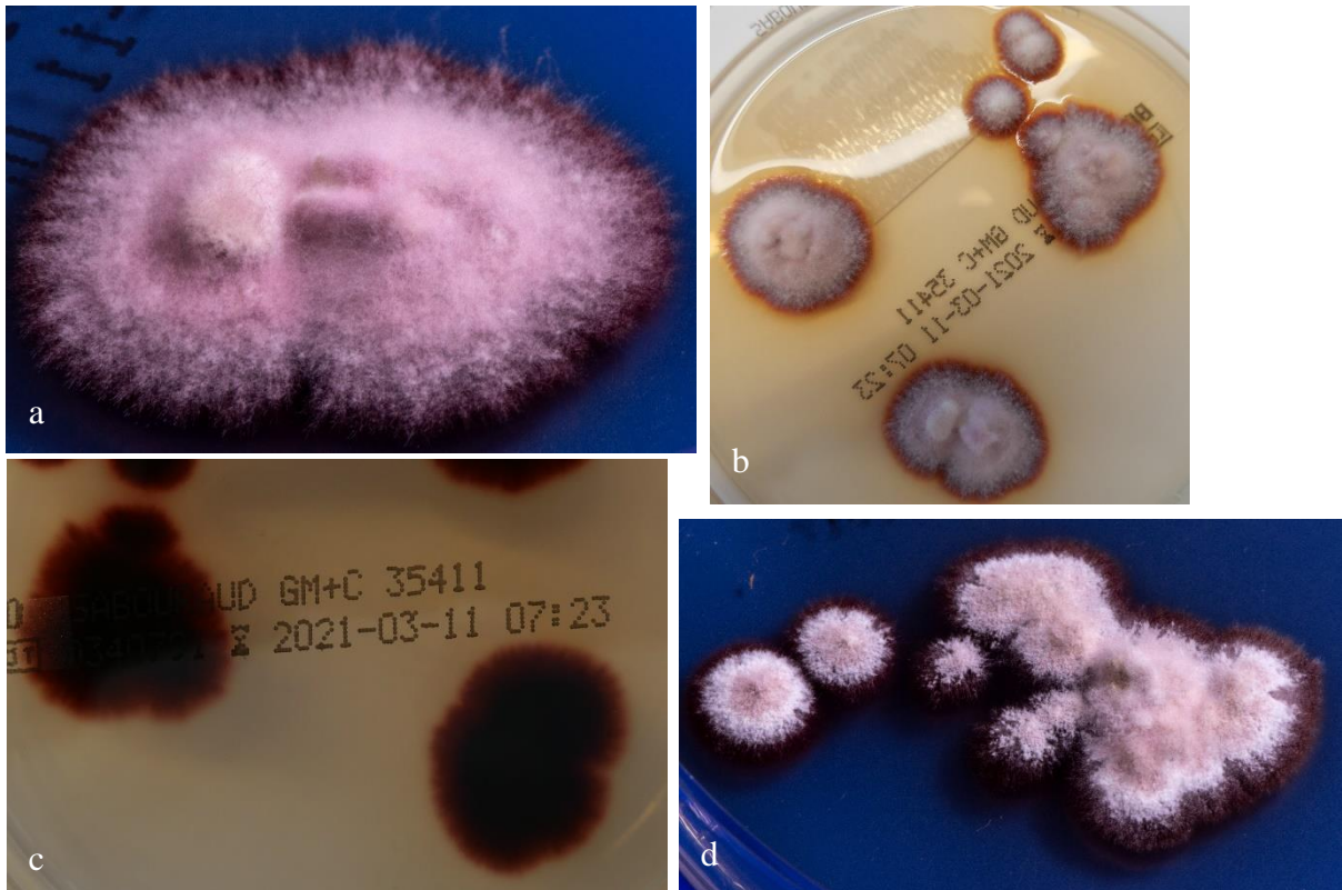
Abb. 2 a Rötliche, flauschige und pudrige Kolonien von A. onychocola auf Sabouraud-Glukose-Agar ohne Cycloheximid. b Weiß-rötliche, pudrige Kolonien von A. onychocola auf Sabouraud-Glukose-Agar ohne Cycloheximid. c Dunkelrote Rückseite von b . d Weiß-rötliche, flauschig-pudrige Kolonien von A. onychocola auf Sabouraud-Glukose-Agar mit Cycloheximid.