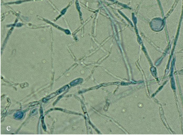
Abb. 3 a Mikroskopisches Bild von A. onychocola mit länglichen, piriformen Mikrokonidien. b Chlamydosporen und septierten Hyphen im Detail. c Chlamydosporen und Hyphen im Detail.