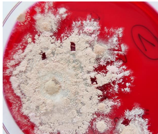
Abb. 1 Auf selektivem Dermatophyten-Agar (Taplin-Agar) entwickeln sich aus den Hautschuppen Kolonien mit granulärer, pudriger, weiß-beiger Oberfläche.

Arthroderma (A.) onychocola ist zuerst 2014 als Trichophyton (T.) onychocola (Čmoková, Hubka, Skorepova & Kolařík) von Hubka et al. beschrieben worden. Der geophile Dermatophyt wurde damals aus einem gelb verfärbten, hyperkeratotischen und onycholytischen Nagel isoliert. Seitdem gelang es im Einzelfall auch in Deutschland, A. onychocola aus Hautschuppen anzuzüchten und zu identifizieren. Wenn kein anderer Erreger außer A. onychocola nachgewiesen wird, kann der Dermatophyt auch als pathogen angesehen werden. Darüber hinaus ist auch in Betracht zu ziehen, dass es sich beim Nachweis dieses Pilzes auch um eine Kontamination bzw. einen „Anflugkeim“ handeln kann. Seit der Neufassung der Taxonomie der Dermatophyten gehört T. onychocola zum Genus Arthroderma und wird jetzt als A. onychocola klassifiziert.